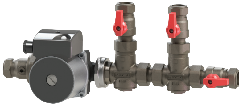
Laddomat 11-30 "Duo"

Laddomat 11-30 „Duo“ erhöht die Effektivität des Ladevorgangs zwischen Biomassekessel und Pufferspeicher.